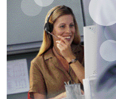
Ett telefonnr till kundtjänst och support.

Glöm långa väntetider på hjälp och teknisk support. Via ett telefonnummer erhåller den enskilde användaren snabb och kompetent hjälp och kan bli guidad direkt på skärmen. Advancekundtjänst har öppet mellan 07.00–18.00.